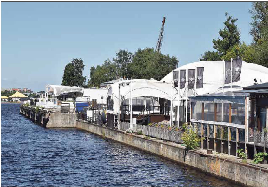
Andrejostas krastmalā esošās kafējnīcas, restorāni, terases, veikali un klubi pamatā ir dažādu nomnieku veidoti ar īslaicīgas lietošanas būves statusu. Eksploataācijas termiņš – 5 līdz 10 gadi.