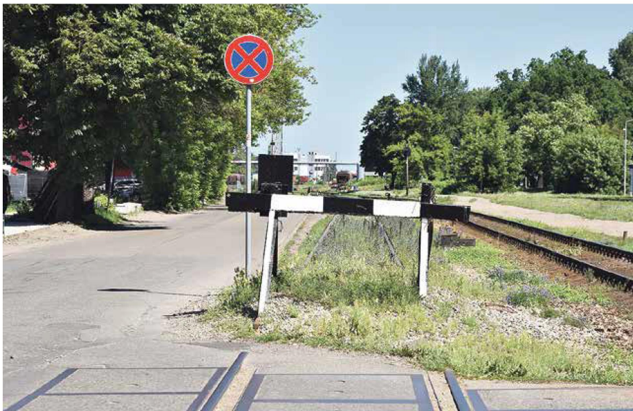
Andrejostas Dienvidu pārbrauktuve un sliežu ceļi kopumā izmaiņas piedzīvos jau pārrēķinātā laika periodā, sola Rīgas pilsētas Attīstības departamentā. Jau ir izsniegtas būvatļaujas vairāku ēku būvniecībai joslā starp Andrejostas akvatoriju un Eksporta ielu, un piekļūšanai šīm ēkām paredzēts izbūvēt jaunu piebraucamo ceļu, kā arī būs jaunas gājēju iezes uz projektā paredzēto publisko promenādi gar Andrejostas krastmalu. Pašreizējo sliežu ceļu vietā, kas sadala Eksporta ielu un Andrejostu, Rīgas detālplānojumā paredzēti vairāki apbūves kvartāli gar Eksporta ielu. Līdz ar kravas vilcienų nokļūšanu Kundziņsalā, sliežu teritorija, kas līdz šim nodalīja Andrejsalu no Rīgas centra, kļūs par vienojošu elementu.